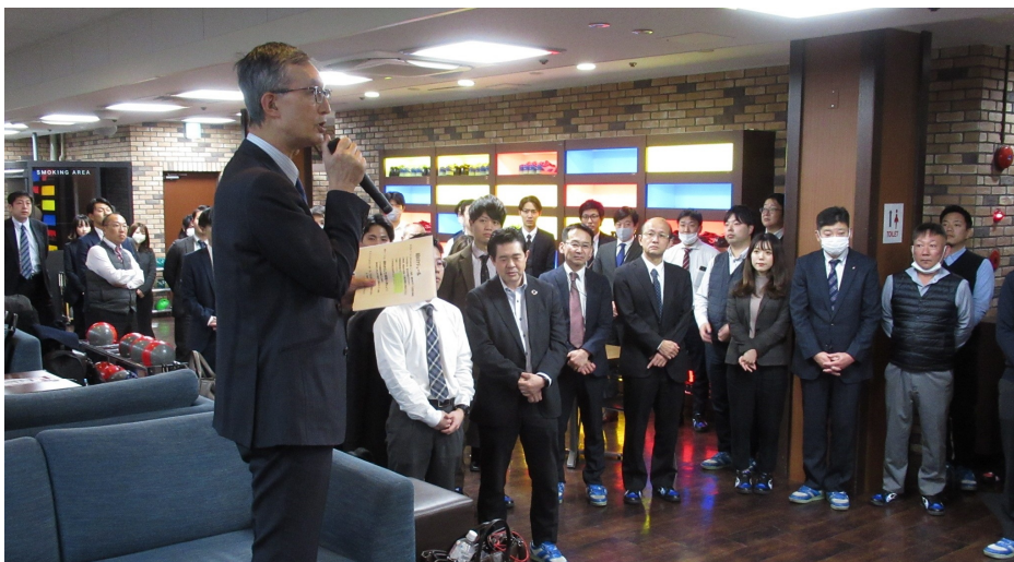
澤田会員交流委員長開会挨拶