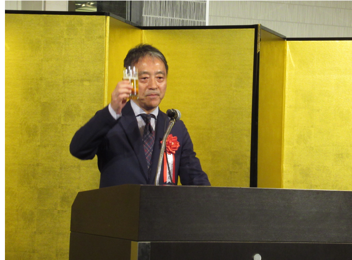
新年の門出を祝って乾杯！