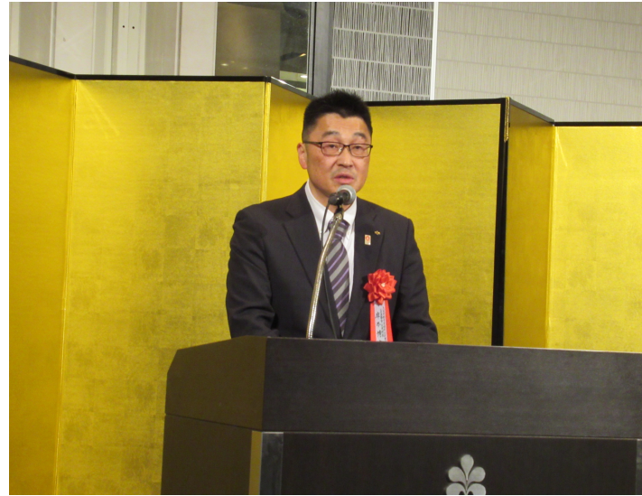
来賓の皆様には祝辞を賜りありがとうございました。