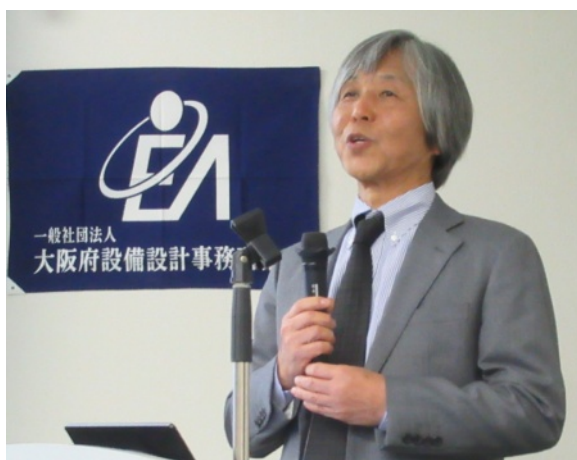
吉住府民啓発委員長より 開会挨拶