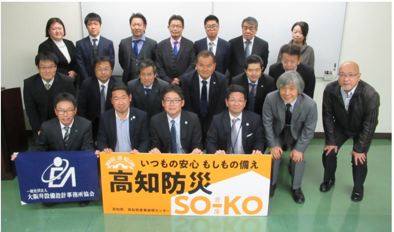
講演者と府民啓発委員メンバー