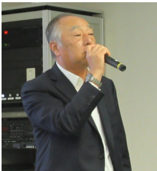
加地会長開会挨拶