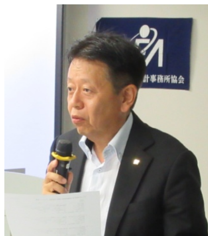
司会・進行：和気副会長