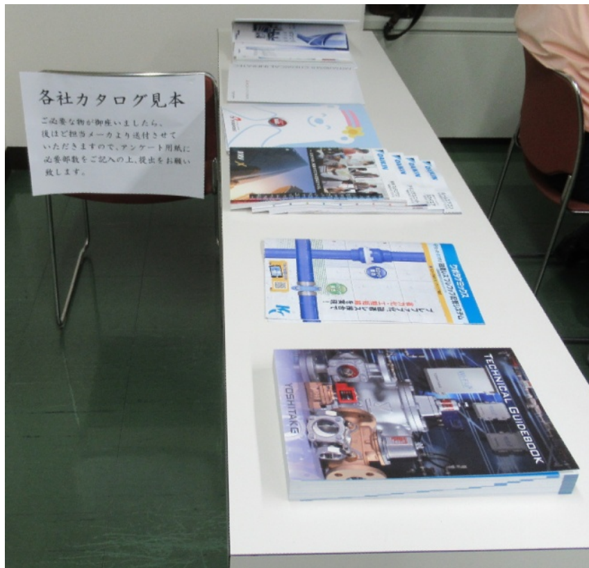
各社カタログ見本