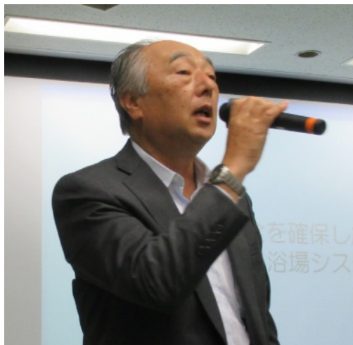
加地会長開会挨拶