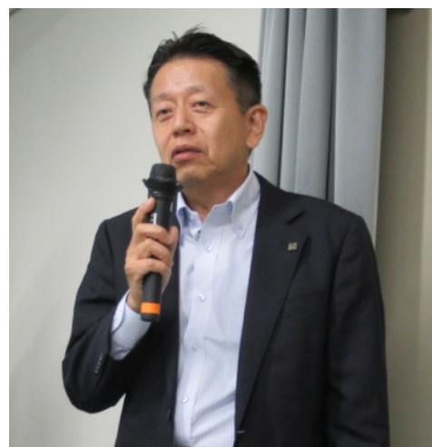
司会・進行：和気副会長