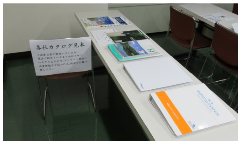
各社カタログ見本