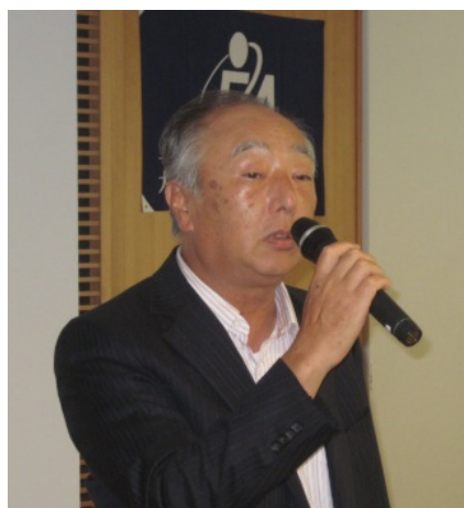
加地会長より開会の挨拶