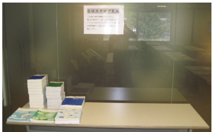
各社カタログ見本