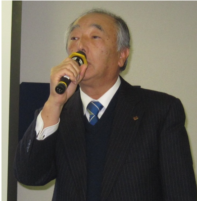
加地会長開会挨拶