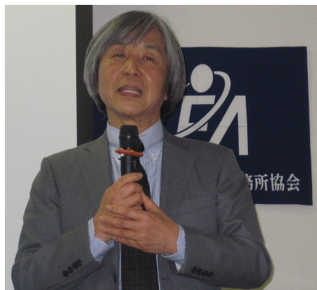
吉住府民啓発委員長閉会挨拶