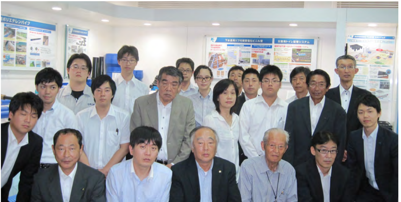
参加の正会員、賛助会員（施工会社）の皆様