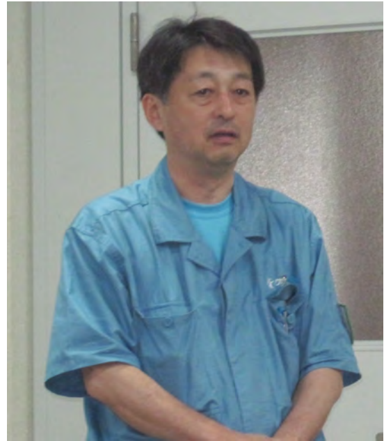
中西工場長：工場概要他説明