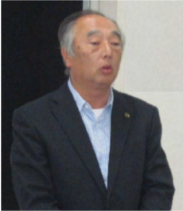
加地会長 閉会並びにお礼の挨拶