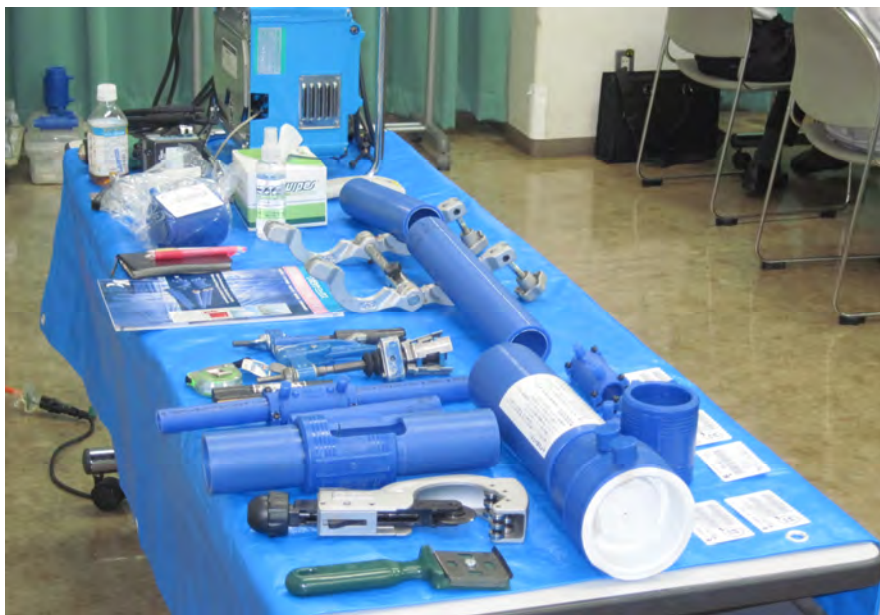
管接合施工実演機材