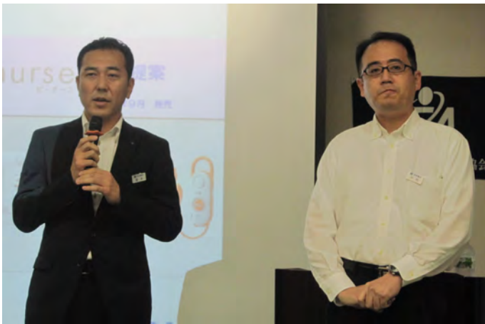
No 14：アイホン(株) 新型ナースコールシステム