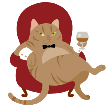
金管合奏団「三毛猫」の皆様が会場を大いに盛り上げてくださいました。