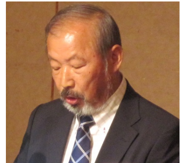
富山財務委員長より 平成 24 年度収支決算報告