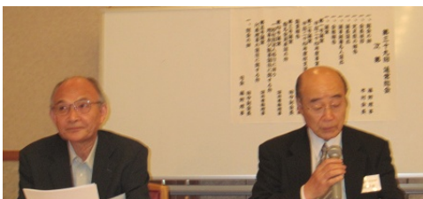
議長の福西相談役(右)と副議長の有澤相談役