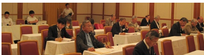
各議案とも満場一致で異議なく承認可決されました